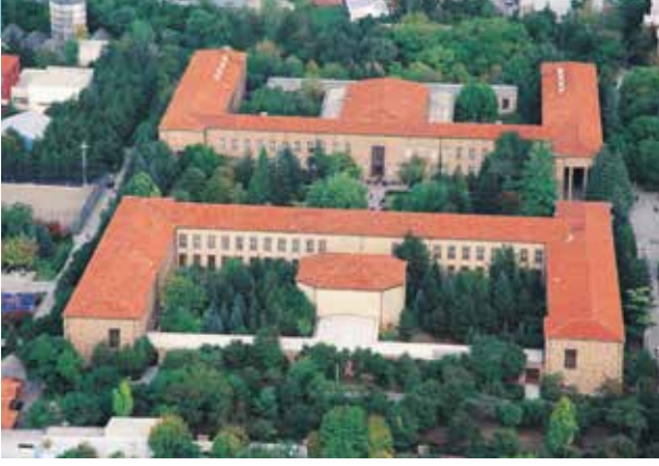
Proje İsmi : Ankara Üniversitesi Tandoğan Kampüsü Şehir : Ankara Yatırımcı : Ankara Üniversitesi Tarih : 2016