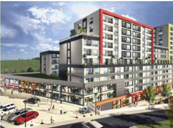
Proje İsmi : Relax Göksu Eryaman Şehir : Ankara Yatırımcı : Fırat Life Style Tarih : 2016