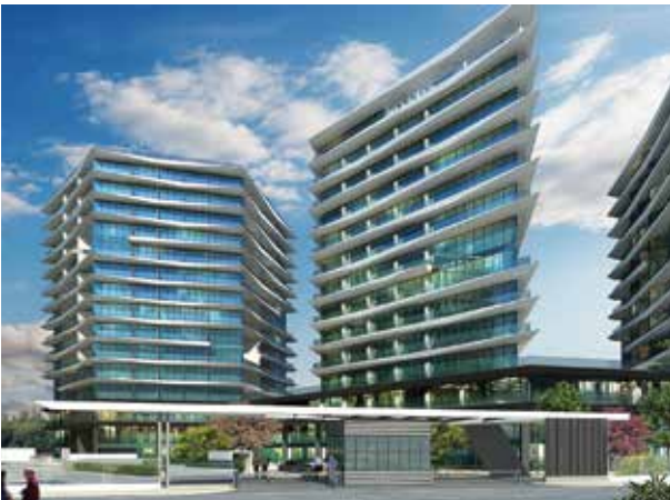
Proje İsmi : Karat 34 Şehir : İstanbul Yatırımcı : Emlak Konut GYO, Doğa Şehircilik, Başyapı Tarih : 2017