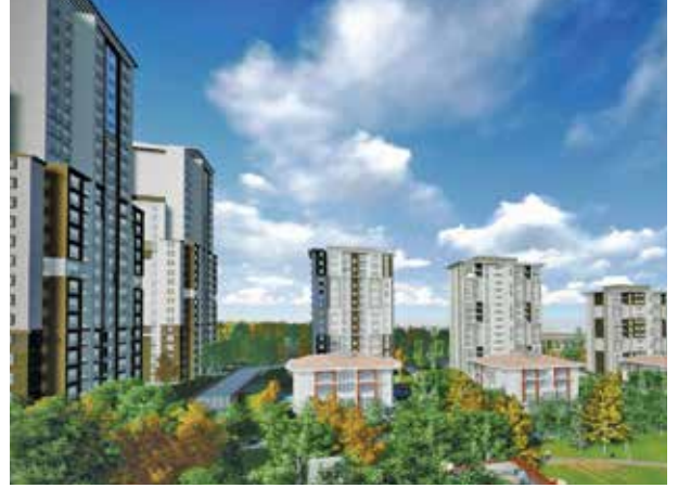
Proje İsmi : Bahçekent Emlak Konutları 1. ve 2. Etap Şehir : İstanbul Yatırımcı : Emlak Konut Gyo, Egemen İnşaat, İlgın İnşaat Tarih : 2015