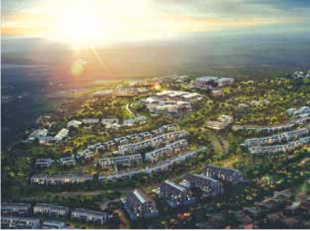
Proje İsmi : Köy Zekeriyaköy Şehir : İstanbul Yatırımcı : Emlak Konut GYO, Siyah Kalem Mühendislik Tarih : 2017