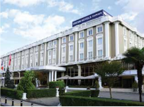
Proje İsmi : Topkapı Eresin Otel Şehir : İstanbul Yatırımcı : Eresin Grup Tarih : 2019