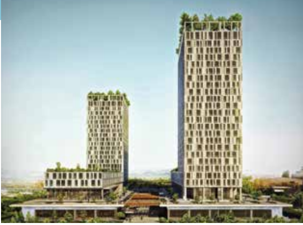
Proje İsmi : Divan Residence G Plus Şehir : İstanbul Yatırımcı : Mar Yapı Tarih : 2015