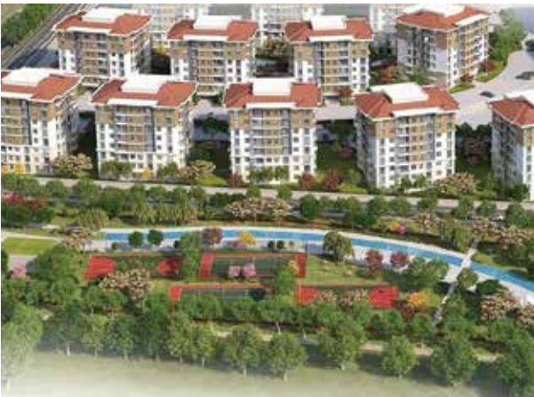
Proje İsmi : Kiptaş Silivri 3. Etap Şehir : İstanbul Yatırımcı : Kiptaş Tarih : 2019