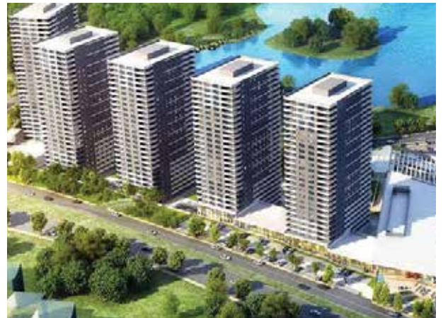
Proje İsmi : Kaşmir Mavi Orkide Evleri Şehir : Ankara Yatırımcı : Gülsan Holding, Köroğlu İnşaat ve MNT İnşaat İş Ortaklığı Tarih : 2019