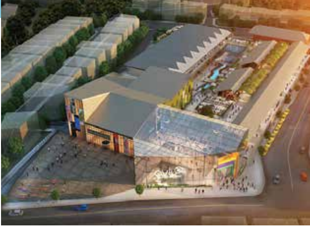
Proje İsmi : Avlu34 AVM Şehir : İstanbul Yatırımcı : Tema Teknik Gayrimenkul Tarih : 2018