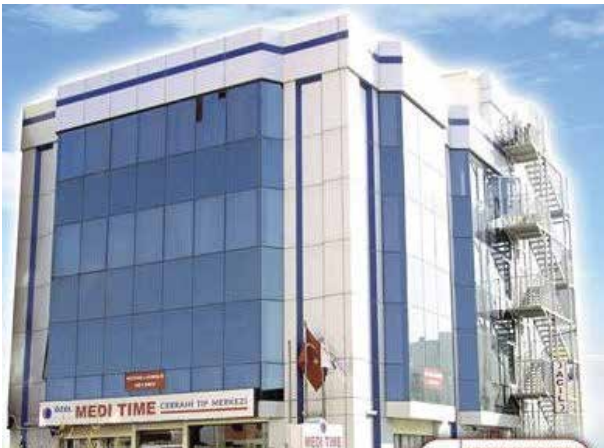
Proje İsmi : Medi Time Cerrahi Tıp Merkezi Şehir : İstanbul Yatırımcı : Meditime Cerrahi Tıp Merkezi Tarih : 2018