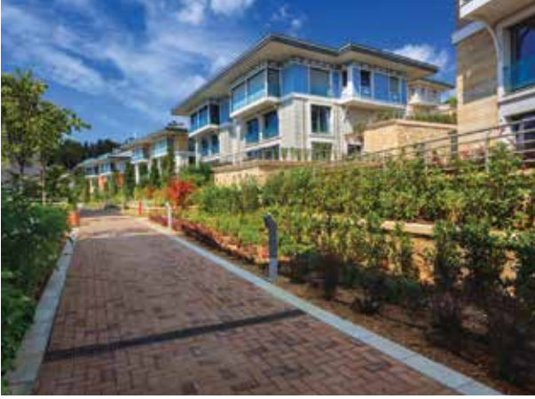
Proje İsmi : Antteras Şehir : İstanbul Yatırımcı : Ant Yapı Tarih : 2015