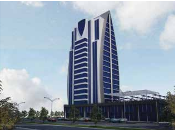
Proje İsmi : Gold N State Şehir : Ankara Yatırımcı : NFN İnşaat A.Ş. Tarih : 2017