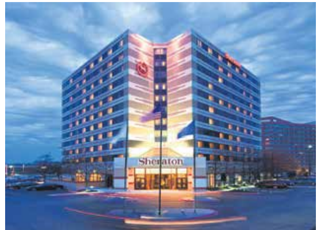
Proje İsmi : Sheraton Abuja Otel Şehir : Abuja, Nijerya Yatırımcı : Rönesans Holding Tarih : 2015