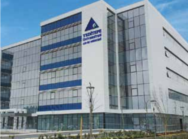
Proje İsmi : Yeditepe Üniversitesi Teknopark Ar-Ge ve Yönetim Binası Şehir : İstanbul Yatırımcı : Yeditepe Üniversitesi Tarih : 2018