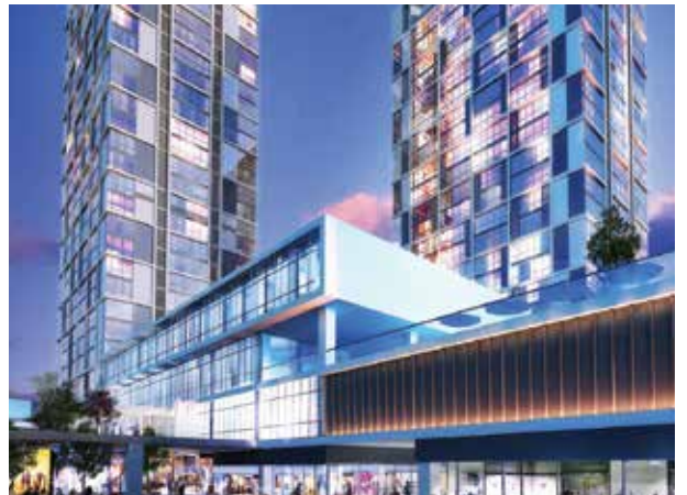
Proje İsmi : Dumankaya Miks Şehir : İstanbul Yatırımcı : Dumankaya İnşaat, Emlak Konut GYO Tarih : 2015