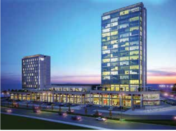
Proje İsmi : HM Commerce Center Şehir : Ankara Yatırımcı : Has Metal Tarih : 2018