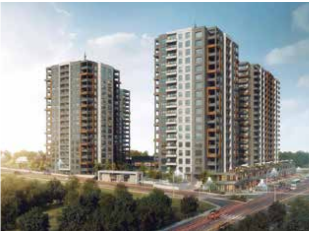
Proje İsmi : Hittown Şehir : Ankara Yatırımcı : Hit Yapı Tarih : 2019