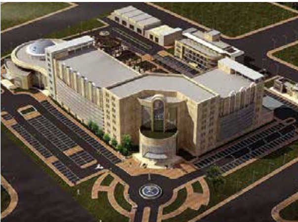
Proje İsmi : Rania 290 Yataklı Devlet Hastanesi Şehir : Süleymaniye, Kuzey Irak Yatırımcı : Kur İnşaat, İntaş İnşaat, Miran İnşaat Tarih : 2015