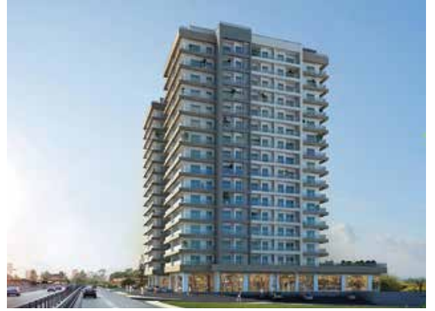
Proje İsmi : Route İstanbul Şehir : İstanbul Yatırımcı : Özyazıcı İnşaat Tarih : 2017