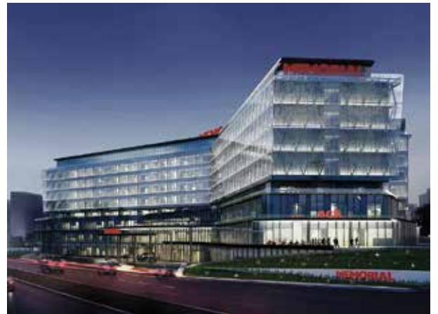
Proje İsmi : Memorial Bahçelievler Hastanesi Şehir : İstanbul Yatırımcı : Memorial Sağlık Grubu Tarih : 2017