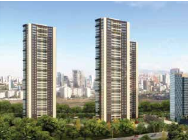
Proje İsmi : YDA Sögütözü Konut Şehir : Ankara Yatırımcı : YDA Grup, Bor-Tor İnşaat Tarih : 2018