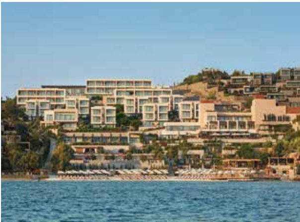
Proje İsmi : The Bodrum Edition - Marriott International Şehir : Bodrum Yatırımcı : Rönesans Holding Tarih : 2015