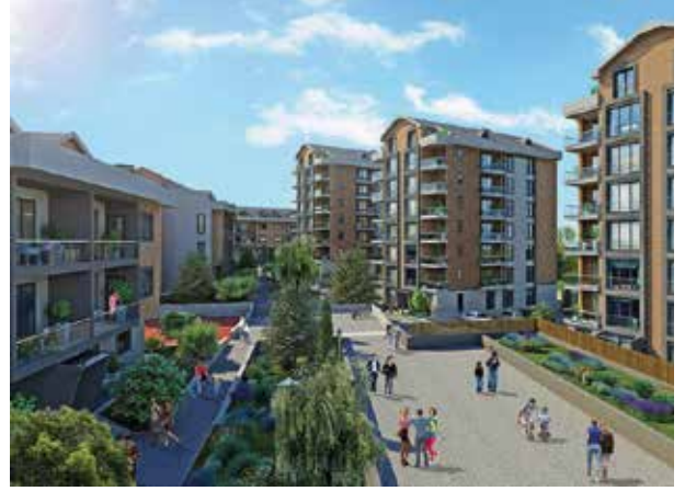
Proje İsmi : Orange City Şehir : Bursa Yatırımcı : Özdilek Holding Tarih : 2016