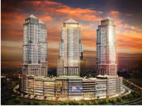
Proje İsmi : Viaport Venezia Şehir : İstanbul Yatırımcı : Bayraktar İnşaat, Gür Yapı Tarih : 2015