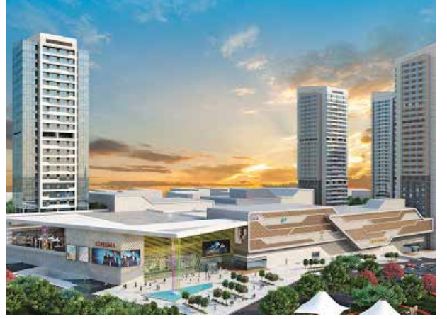
Proje İsmi : Metromall AVM Şehir : Ankara Yatırımcı : Söğüt İnşaat Tarih : 2016