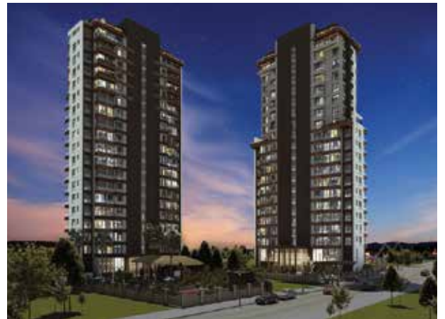
Proje İsmi : Emperia Dragos Şehir : İstanbul Yatırımcı : Ulusal Grup Tarih : 2018