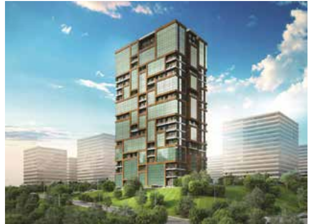
Proje İsmi : Alya Life Residence Şehir : İstanbul Yatırımcı : Ekşioğlu Yapı Tarih : 2017