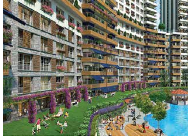
Proje İsmi : Ege Vadisi Şehir : Ankara Yatırımcı : Sinpaş GYO Tarih : 2017