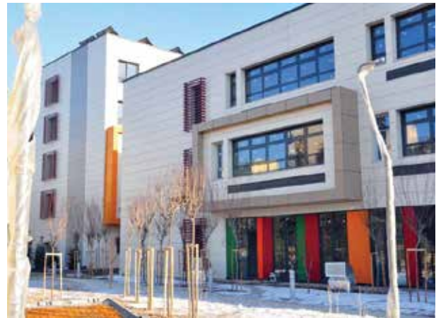
Proje İsmi : Cezeri Yeşil Teknoloji Mesleki ve Teknik Anadolu Lisesi Şehir : Ankara Yatırımcı : T.C. Milli Eğitim Bakanlığı Tarih : 2016