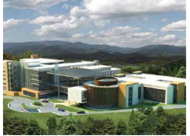
Proje İsmi : Sarıyer Eğitim ve Araştırma Hastanesi Şehir : İstanbul Yatırımcı : T.C. Sağlık Bakanlığı, YDA İnşaat Tarih : 2015