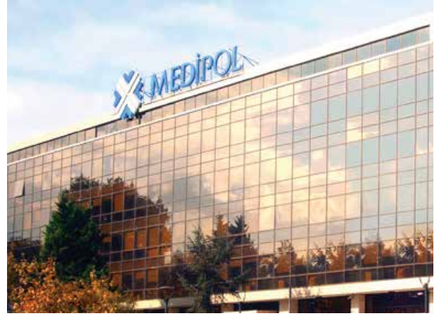
Proje İsmi : Medipol Üniversitesi Dış Hastanesi Şehir : İstanbul Yatırımcı : Medipol Sağlık Grubu Tarih : 2019