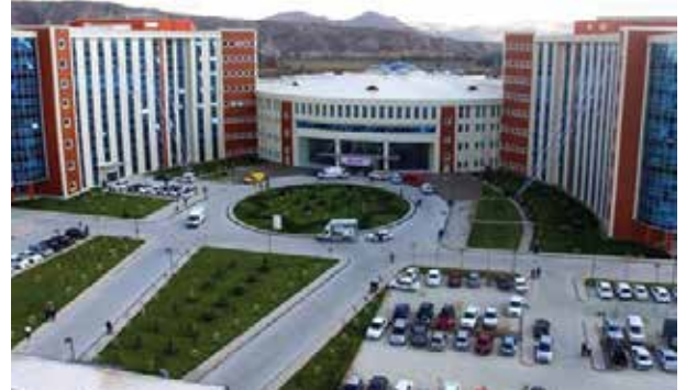
Proje İsmi : Sivas Numune Hastanesi 250 Yataklı Ek Bina Şehir : Sivas Yatırımcı : T.C. Sağlık Bakanlığı Tarih : 2018