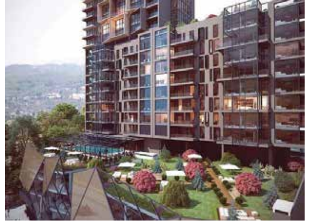
Proje İsmi : SO Yapı Residence Şehir : Ankara Yatırımcı : So Yapı Tarih : 2019