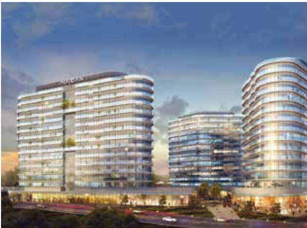
Proje İsmi : Maidan Residence Şehir : Ankara Yatırımcı : Ege Grup Yapı Endüstrisi A.Ş., BM Mühendislik ve İnşaat A.Ş. Tarih : 2016