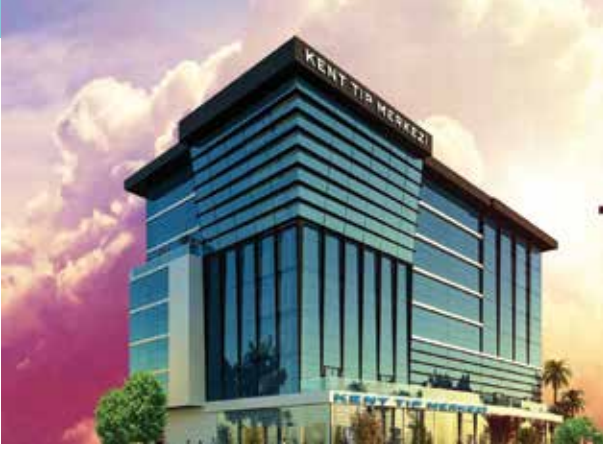
Proje İsmi : Kent Bayraklı Tıp Merkezi Şehir : İzmir Yatırımcı : Kent Sağlık Grubu Tarih : 2017