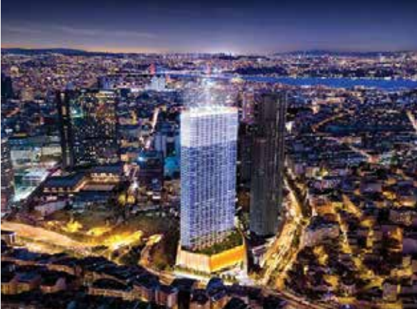
Proje İsmi : Queen Central Park Şehir : İstanbul Yatırımcı : Sinpaş GYO Tarih : 2017