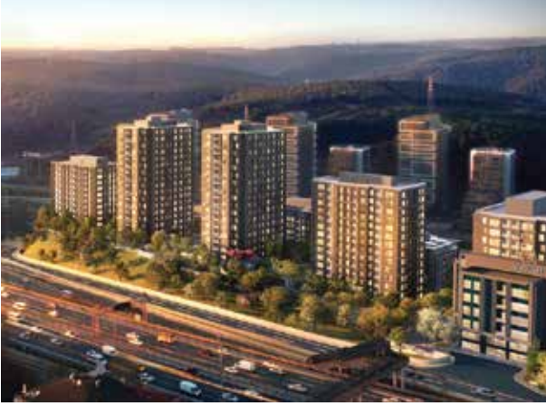
Proje İsmi : Avangart İstanbul Şehir : İstanbul Yatırımcı : Emlak Konut GYO, Gül Proje Tarih : 2020