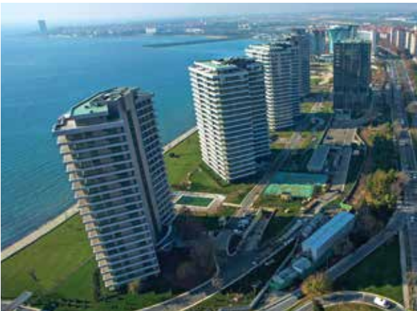
Proje İsmi : Yalı Ataköy Şehir : İstanbul Yatırımcı : Özyazıcı İnşaat, Karadeniz Örme Tarih : 2015