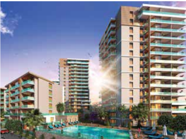
Proje İsmi : Park Yaşam Santorini Şehir : İzmir Yatırımcı : İzka İnşaat Tarih : 2019