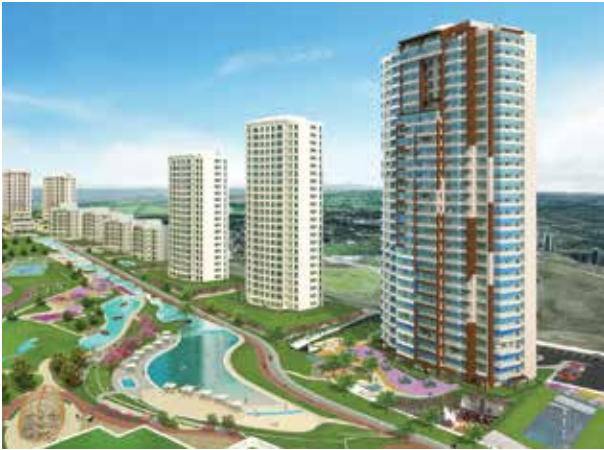
Proje İsmi : İncek Blue Şehir : Ankara Yatırımcı : Sinpaş GYO Tarih : 2015