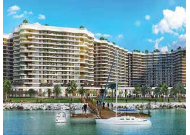
Proje İsmi : Blue Lake Küçükçekmece Şehir : İstanbul Yatırımcı : Metal Yapı, Karmen Yapı Tarih : 2016