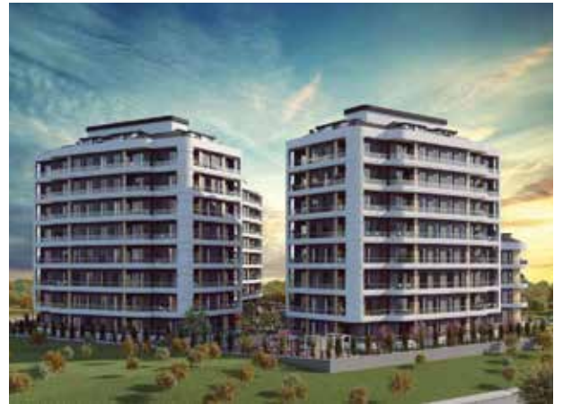
Proje İsmi : Avçılar Mars19 Şehir : İstanbul Yatırımcı : Metraco A.Ş. Tarih : 2018