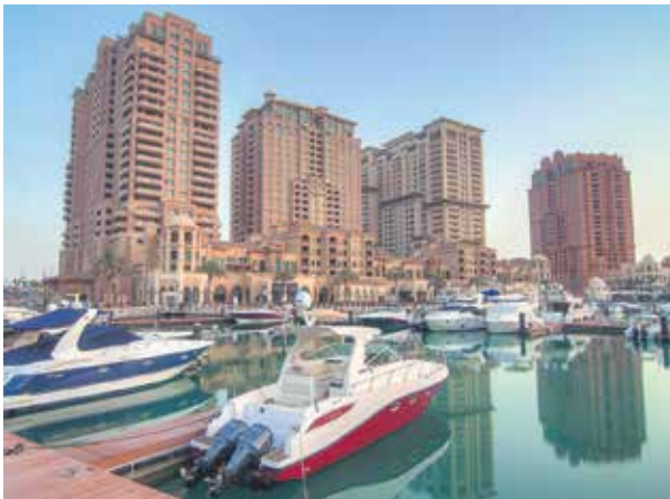
Proje İsmi : Porto Arabia Apartments Şehir : Doha, Katar Yatırımcı : United Development Company Tarih : 2015