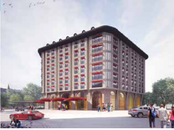
Proje İsmi : Merter İbis Style Hotel Şehir : İstanbul Yatırımcı : Doğan Tekstil Tarih : 2020