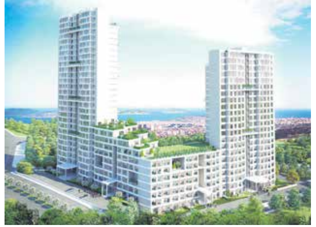
Proje İsmi : Rönesans Sayfiye Şehir : İstanbul Yatırımcı : Rönesans Holding Tarih : 2015