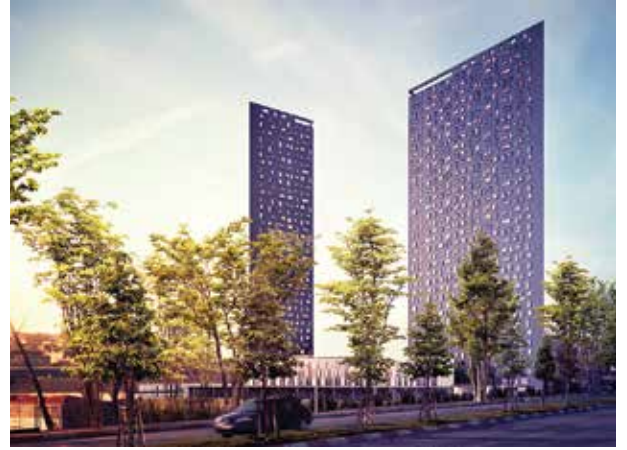
Proje İsmi : G-Yoo Inspired by Starck Şehir : İstanbul Yatırımcı : Mar Yapı Tarih : 2017