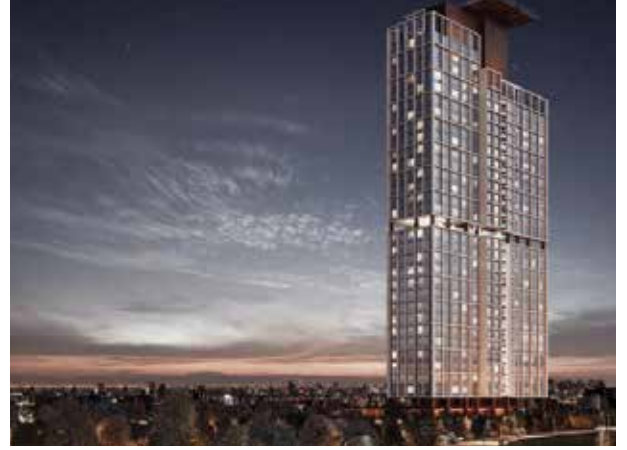
Proje İsmi : Konum Beytepe Şehir : Ankara Yatırımcı : Tarmac Agrega Madencilik ve Yapı Tarih : 2019