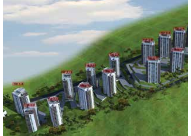
Proje İsmi : TOKİ Gölbaşı İncek Konutları Şehir : Ankara Yatırımcı : YDA İnşaat ve Yüksel İnşaat Konsorsiyumu Tarih : 2016