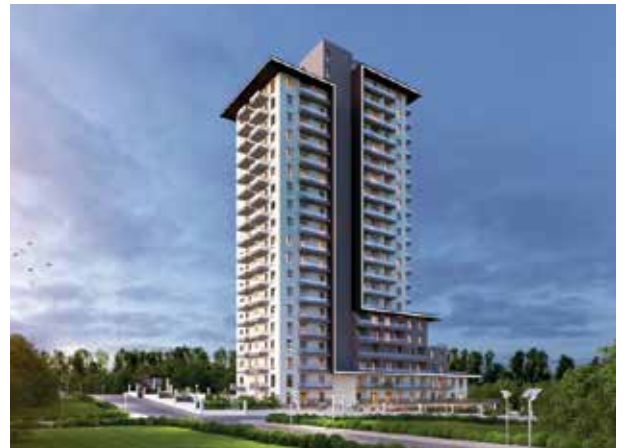
Proje İsmi : Mia Vita Konutları Beytepe Şehir : Ankara Yatırımcı : Anadolu Akaryakıt Tarih : 2016