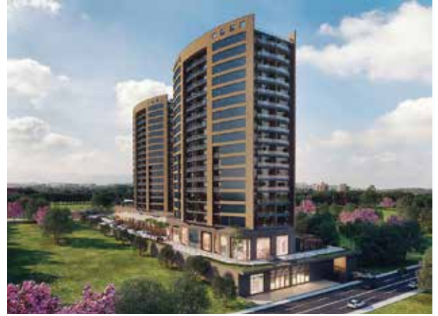
Proje İsmi : Ataköy Towers Şehir : İstanbul Yatırımcı : Aziz Yapı Tarih : 2016