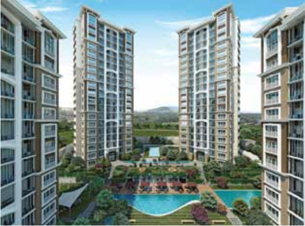
Proje İsmi : Sofa Loca Şehir : Ankara Yatırımcı : Emlak Konut GYO, Baş Yapı, Solar Yapı Tarih : 2016