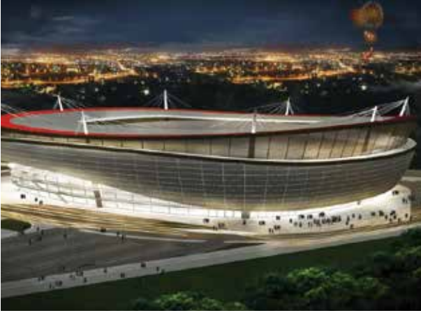
Proje İsmi : Eskişehir Stadyumu Şehir : Eskişehir Yatırımcı : T.C. Gençlik ve Spor Bakanlığı Tarih : 2015