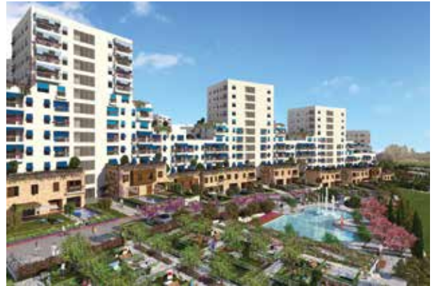
Proje İsmi : Ege Yakası Şehir : İstanbul Yatırımcı : Sinpaş GYO Tarih : 2016