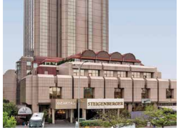
Proje İsmi : Maslak Hilton Otel Şehir : İstanbul Yatırımcı : Summa İnşaat Tarih : 2017