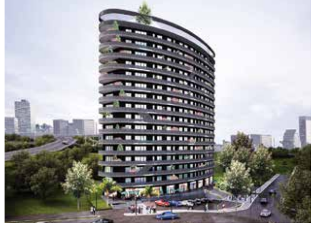
Proje İsmi : Parima Merter Şehir : İstanbul Yatırımcı : Fer Yapı Tarih : 2015