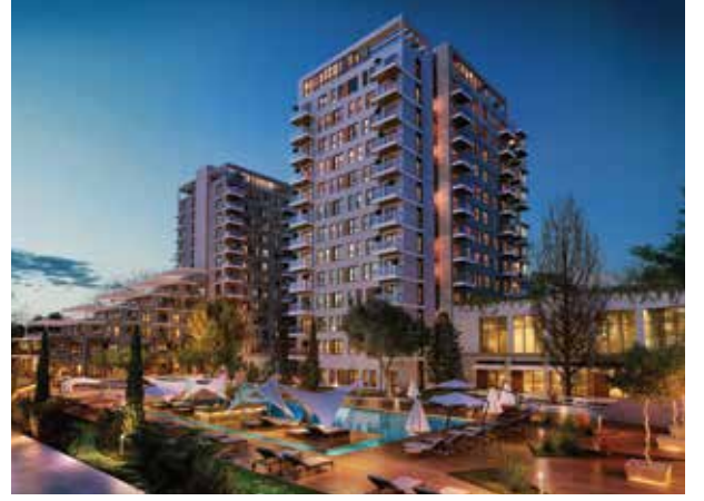
Proje İsmi : Nef Sancaktepe Şehir : İstanbul Yatırımcı : Timur Gayrimenkul Tarih : 2019