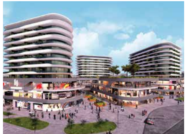
Proje İsmi : Real Merter Şehir : İstanbul Yatırımcı : Oliv Yapı, Vizyon Art Yapı Tarih : 2016