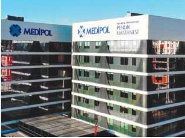
Proje İsmi : Pendik Medipol Üniversitesi Hastanesi Şehir : İstanbul Yatırımcı : Medipol Sağlık Grubu Tarih : 2019