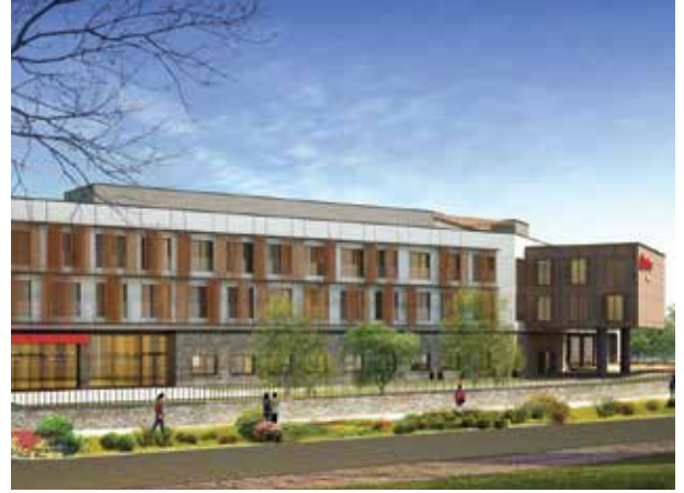
Proje İsmi : Hampton by Hilton İzmir Aliğa Şehir : İzmir Yatırımcı : Hilton Hotels & Resorts Tarih : 2016