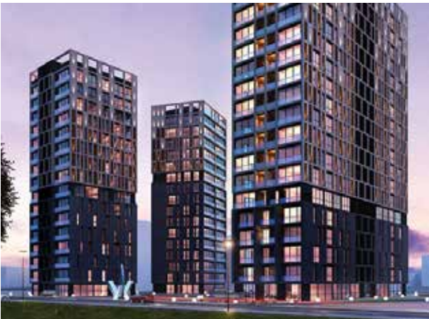
Proje İsmi : Dekon Suadiye Ametist Şehir : İstanbul Yatırımcı : Dekon İnşaat Tarih : 2016