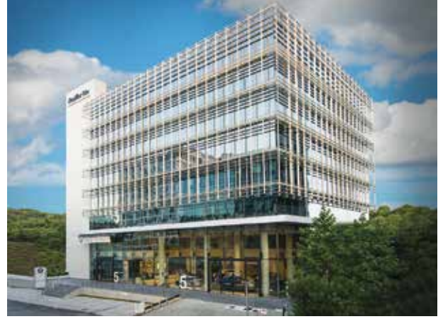
Proje İsmi : Kosifler Kavacak Ofis Şehir : İstanbul Yatırımcı : Kosifler İnşaat Tarih : 2016