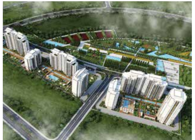
Proje İsmi : Bahçekent Flora Şehir : İstanbul Yatırımcı : Emlak Konut GYO, İzka İnşaat, Dağ Mühendislik, Sitar İnşaat Tarih : 2016