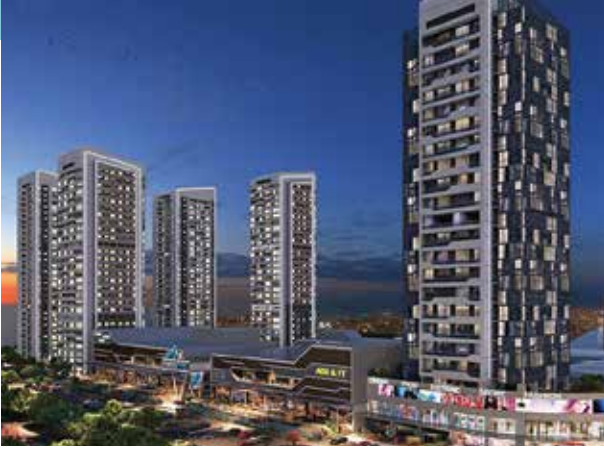
Proje İsmi : MetroMall Şehir : Ankara Yatırımcı : Söğüt İnşaat Tarih : 2016