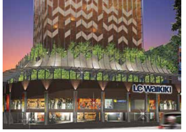
Proje İsmi : Malatya LCW Şehir : Malatya Yatırımcı : LCW Tarih : 2018