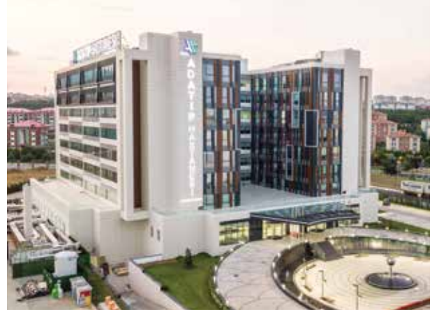
Proje İsmi : Özel Adatıp Hastanesi Şehir : İstanbul Yatırımcı : Adatıp Sağlık Grubu Tarih : 2016