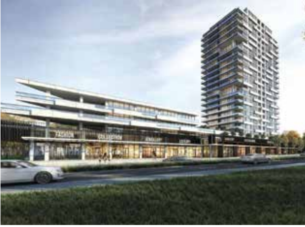
Proje İsmi : Avend Çayyolu Şehir : Ankara Yatırımcı : Rast İnşaat Tarih : 2019