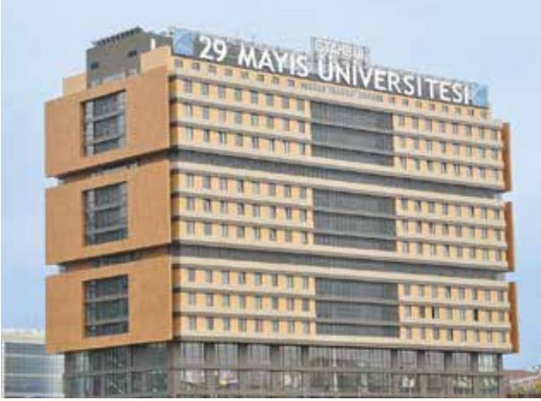
Proje İsmi : 29 Mayıs Üniversitesi Kız Öğrenci Yurdu Şehir : İstanbul Yatırımcı : 29 Mayıs Üniversitesi Tarih : 2015