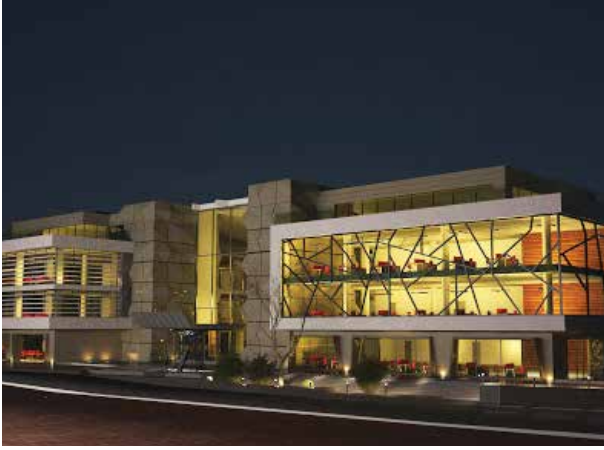
Proje İsmi : Denizciler İş Merkezi Şehir : İstanbul Yatırımcı : Deniz Nakliyat Tarih : 2016