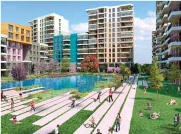
Proje İsmi : Aydos Country Şehir : İstanbul Yatırımcı : Sinpaş GYO Tarih : 2016