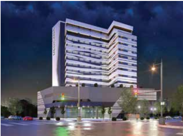
Proje İsmi : Medicana İzmir Hastanesi Şehir : İzmir Yatırımcı : Medicana Sağlık Grubu Tarih : 2019