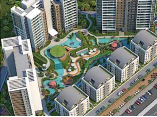
Proje İsmi : Seyran Şehir Şehir : İstanbul Yatırımcı : Emlak Konut GYO, Makro İnşaat, Akyapı Tarih : 2016