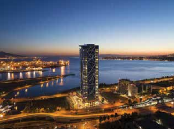
Proje İsmi : İzkaport Şehir : İzmir Yatırımcı : İzka İnşaat Tarih : 2020