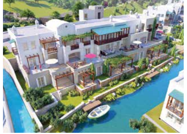
Proje İsmi : Anthaven Şehir : Bodrum Yatırımcı : Ant Yapı Tarih : 2020