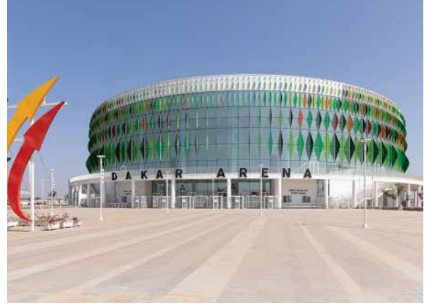
Proje İsmi : Senegal Dakar Arena Şehir : Senegal Yatırımcı : Summa İnşaat Tarih : 2017