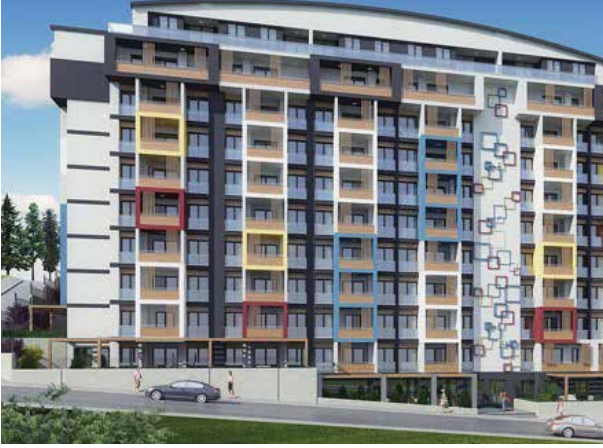
Proje İsmi : Yalçınlar Yaşam Görükle Şehir : Bursa Yatırımcı : Turumtaş İnşaat Tarih : 2017