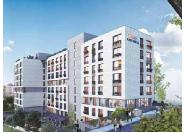
Proje İsmi : Antwell Şehir : İstanbul Yatırımcı : Ant Yapı Tarih : 2019