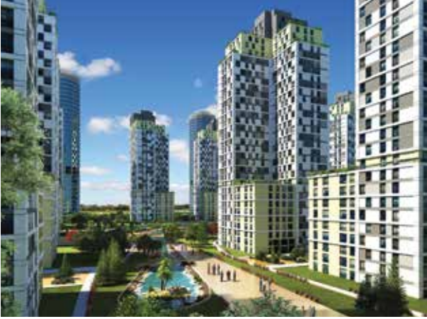
Proje İsmi : Kristal Şehir Şehir : İstanbul Yatırımcı : İhlas İnşaat A.Ş. Tarih : 2015