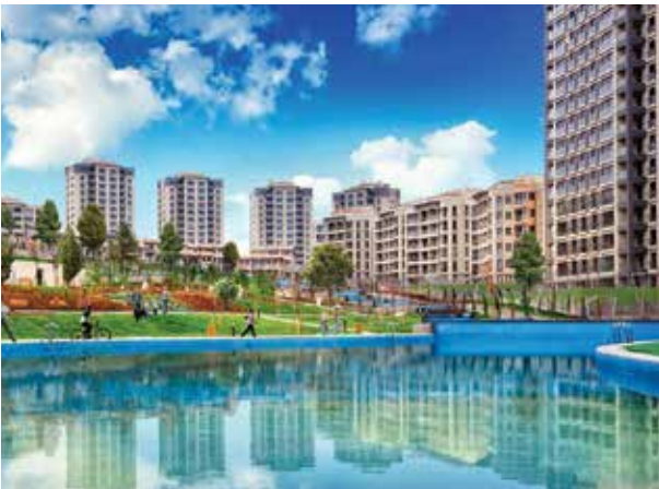
Proje İsmi : İncek Life Şehir : Ankara Yatırımcı : Sinpaş GYO Tarih : 2016