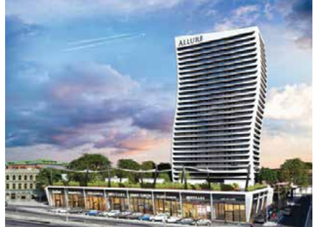
Proje İsmi : Allure Tower Şehir : İstanbul Yatırımcı : Doruk GYO Tarih : 2016