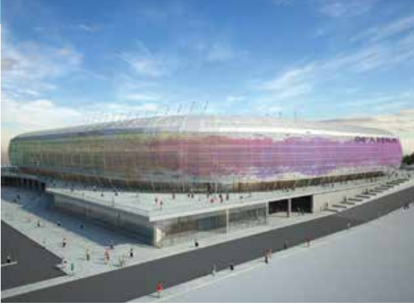
Proje İsmi : Eryaman Stadyumu Şehir : Ankara Yatırımcı : T.C. Gençlik ve Spor Bakanlığı Tarih : 2018