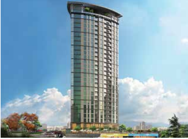
Proje İsmi : NND 100 Tower Şehir : İstanbul Yatırımcı : Nanda Yapı Tarih : 2016