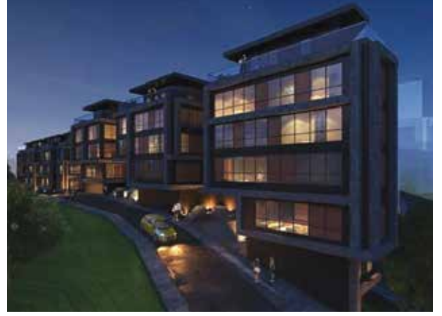
Proje İsmi : Nef 25B Şehir : İstanbul Yatırımcı : Nef İnşaat Tarih : 2017