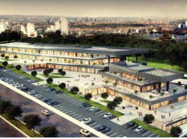
Proje İsmi : Kaşmir Center Şehir : Ankara Yatırımcı : Kaşmir Yapı Tarih : 2017