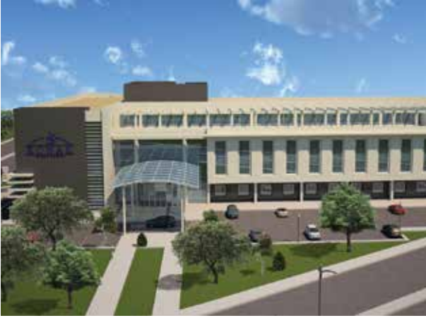
Proje İsmi : Özel Konak Sakarya Hastanesi Şehir : Sakarya Yatırımcı : Konak Sağlık Grubu Tarih : 2016