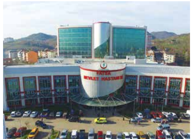
Proje İsmi : Fatsa Devlet Hastanesi Şehir : Ordu Yatırımcı : T.C. Sağlık Bakanlığı Tarih : 2015