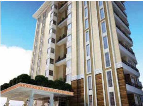
Proje İsmi : Pasha Loft Bilkent Şehir : Ankara Yatırımcı : Pasha Concept İnşaat Tarih : 2016