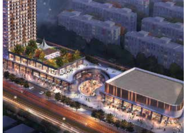
Proje İsmi : Beker Plaza Şehir : Ankara Yatırımcı : Beker Grup Tarih : 2017