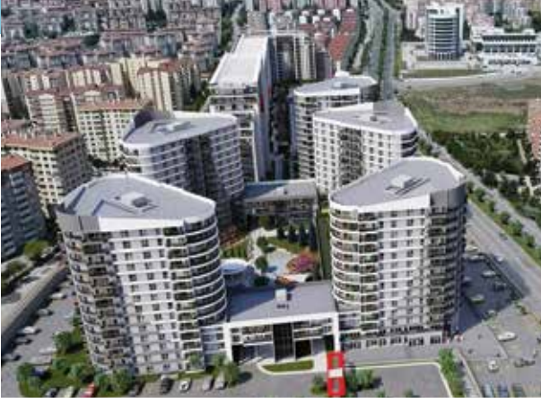
Proje İsmi : Gala Batıkent Şehir : Ankara Yatırımcı : Kızıltoprak Gayrimenkul A.Ş. Tarih : 2019