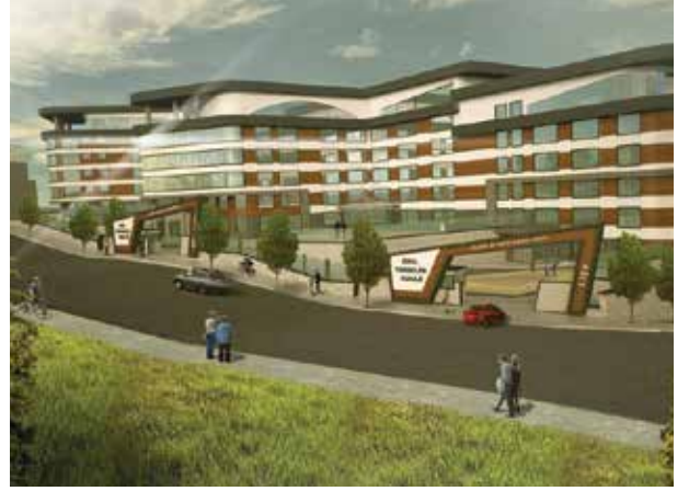
Proje İsmi : Yükselen Koleji Mamak Kampüsü Şehir : Ankara Yatırımcı : Yükselen Koleji Tarih : 2018