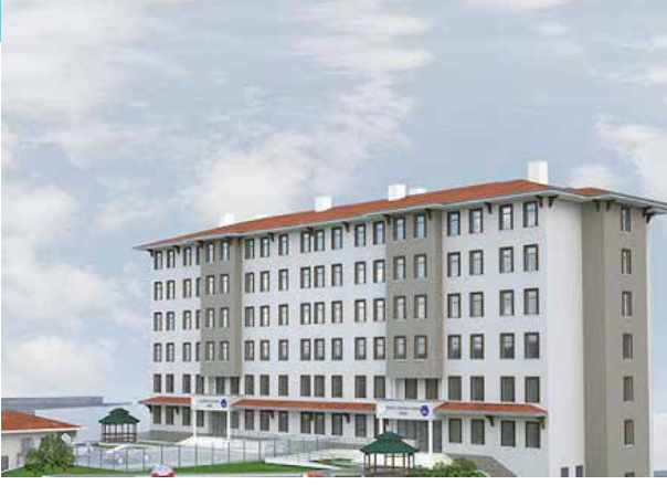
Proje İsmi : Rize Ardeşen 300 Kişilik Yurt Şehir : Rize Yatırımcı : Kredi ve Yurtlar Kurumu Tarih : 2019