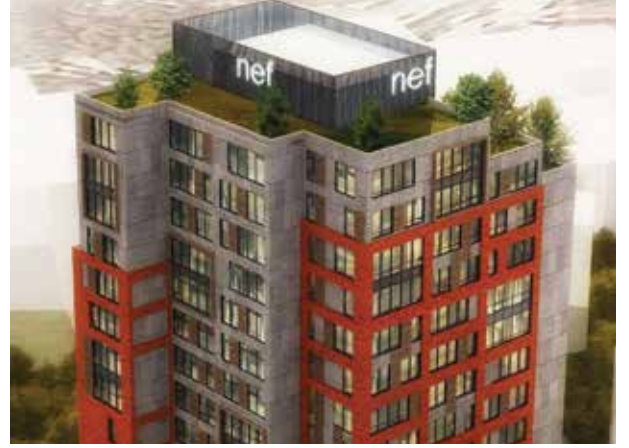
Proje İsmi : Nef 98 Şehir : İstanbul Yatırımcı : Timur Gayrimenkul Tarih : 2016