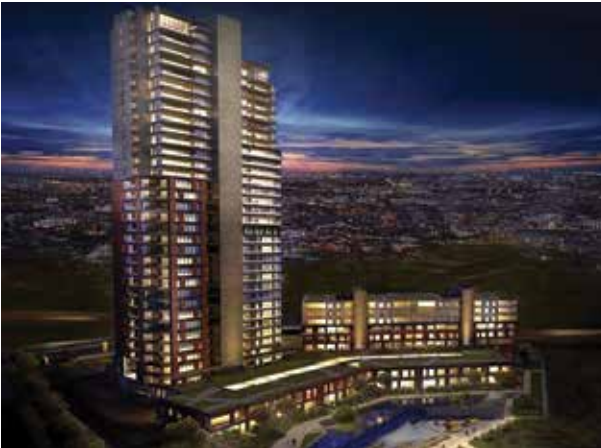
Proje İsmi : Elit Manzara Beytepe Şehir : Ankara Yatırımcı : Elit Yapı Tarih : 2017