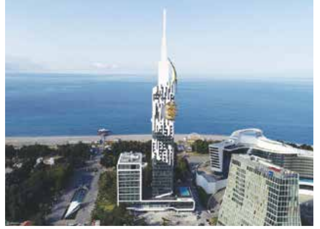
Proje İsmi : Le Méridien Batumi Şehir : Gürcistan Yatırımcı : Redko İnşaat Tarih : 2019