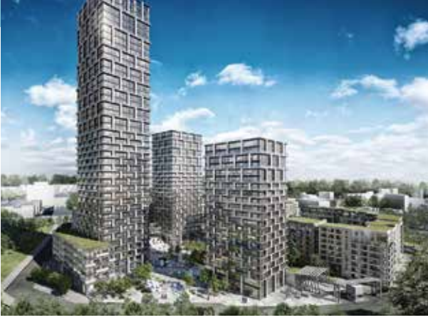
Proje İsmi : AND Pastel Şehir : İstanbul Yatırımcı : AND Gayrimenkul Tarih : 2017