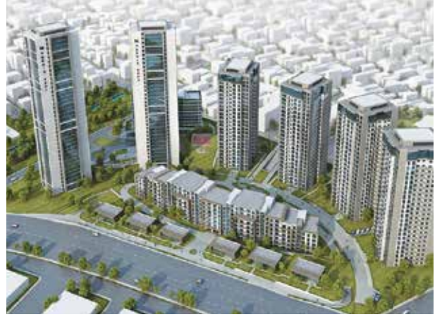
Proje İsmi : Metropark Şehir : İstanbul Yatırımcı : Teknik Yapı Tarih : 2015