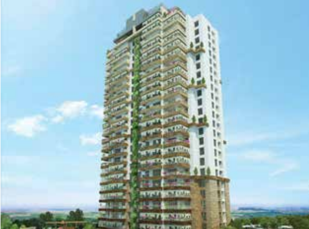
Proje İsmi : İncek Green Şehir : İstanbul Yatırımcı : Sinpaş GYO Tarih : 2016