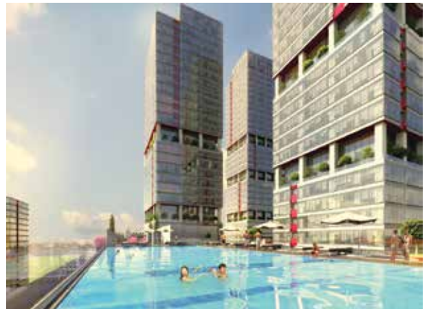
Proje İsmi : Dumankaya Ritim Şehir : İstanbul Yatırımcı : Dumankaya İnşaat Tarih : 2015