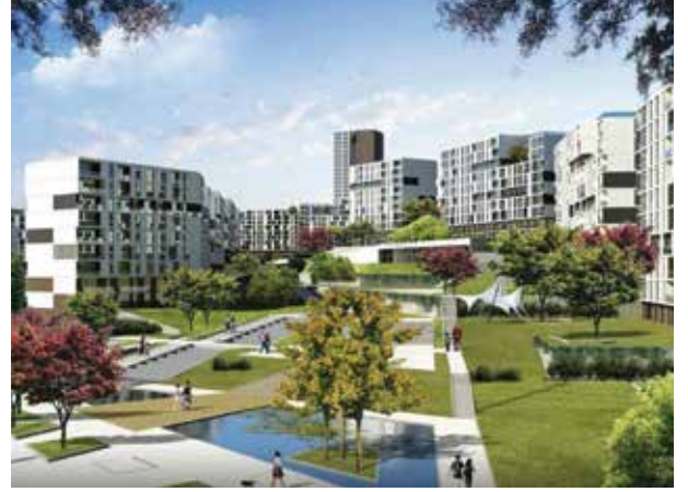
Proje İsmi : Başakşehir Evleri Şehir : İstanbul Yatırımcı : Emlak Konut GYO, Türkerler İnşaat Tarih : 2015