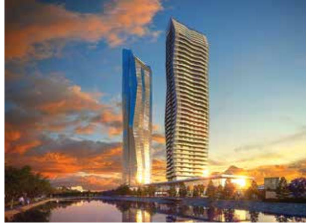
Proje İsmi : Mistral İzmir Şehir : İzmir Yatırımcı : Miray İnşaat Tarih : 2015