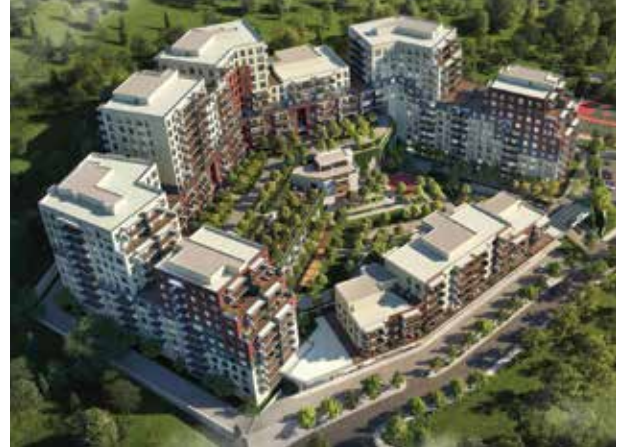
Proje İsmi : Yeniköy Konakları Şehir : İstanbul Yatırımcı : Emlak Konut GYO, Aydur İnşaat Tarih : 2020