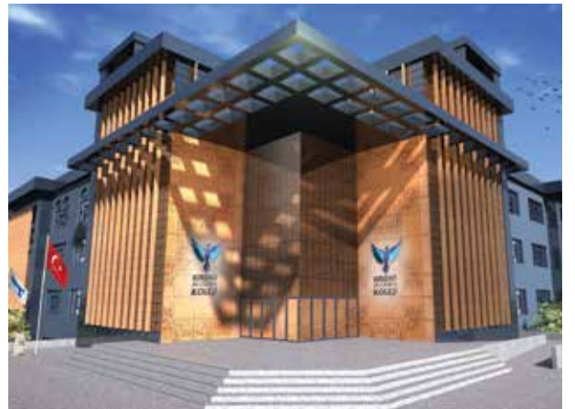
Proje İsmi : Kırdar Bilgiören Koleji Şehir : Kütahya Yatırımcı : Kırdar Grup Tarih : 2017