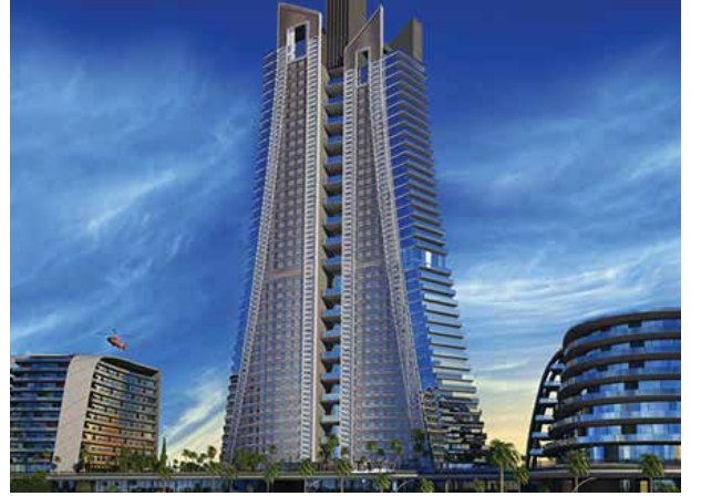
Proje İsmi : Sarphan Finanspark Şehir : İstanbul Yatırımcı : Emlak Konut GYO Tarih : 2015