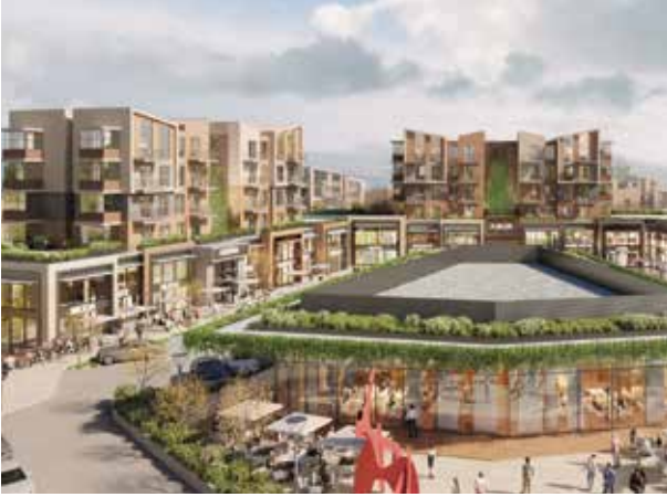
Proje İsmi : Nef Çekmeköy Şehir : İstanbul Yatırımcı : Timur Gayrimenkul Tarih : 2019