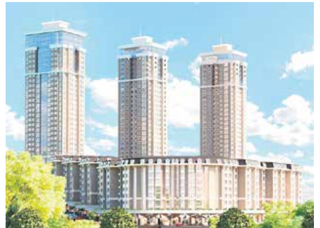
Proje İsmi : Trendist Ataşehir Şehir : İstanbul Yatırımcı : Solid İnşaat, K Yapı Tarih : 2015