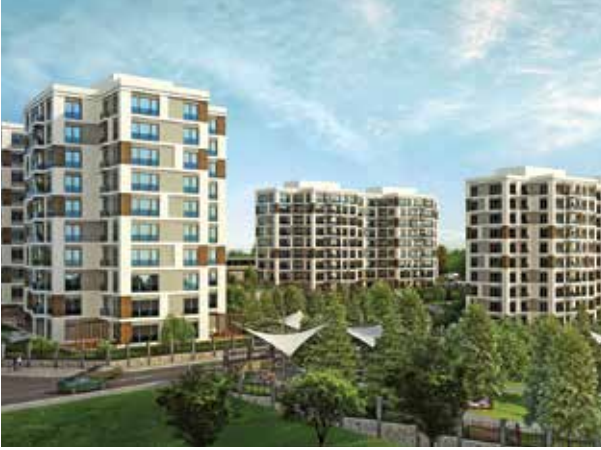
Proje İsmi : Sancaktepe Adres Kuru Şehir : İstanbul Yatırımcı : Bayraktar İnşaat Tarih : 2017